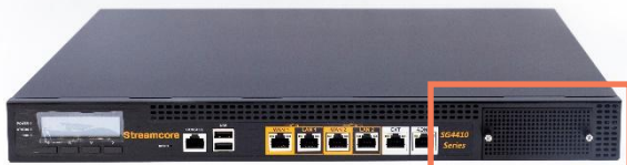
Tiroir pour extensions réseau